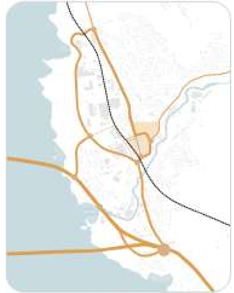
NY BRU, JERNBANE OG RINGVEI

Illustrasjon: Mulighetsstudie Moelv stasjonsområde, Norconsult